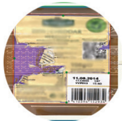
LABEL DETECTIE EN ORIËNTATIE