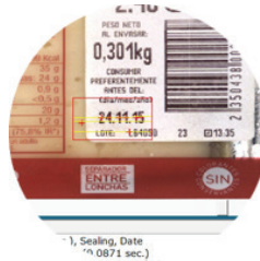
OPTISCHE KARAKTER HERKENNING